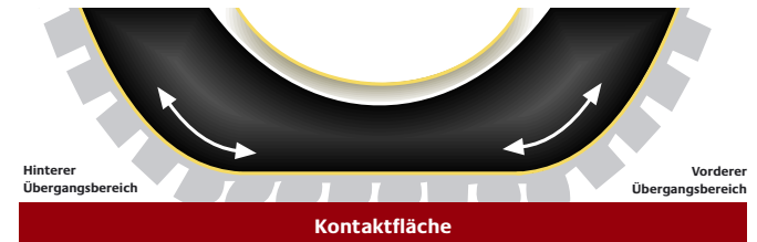
Abb.: Energieverlust aufgrund der Verformung in der Kontaktfläche

Diese wesentliche Änderung in der Gummimischung führt zu einer spürbaren Verbesserung des Rollwiderstands um bis zu 30 Prozent im Vergleich zu herkömmlichen Reifen.